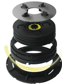
Samonivelačné terče PROFÍ